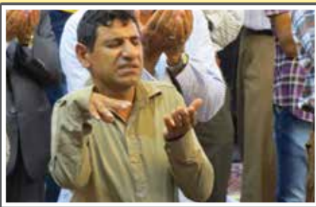
«نماز عید فطر در حسینیه اعظم»