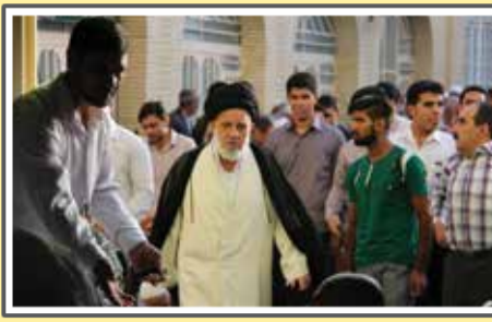
«نماز عید فطر»