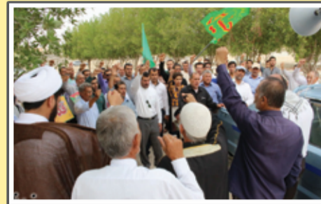
«راهپیمایی روز فقس در فداغ - عکس: Fedagh.ir»