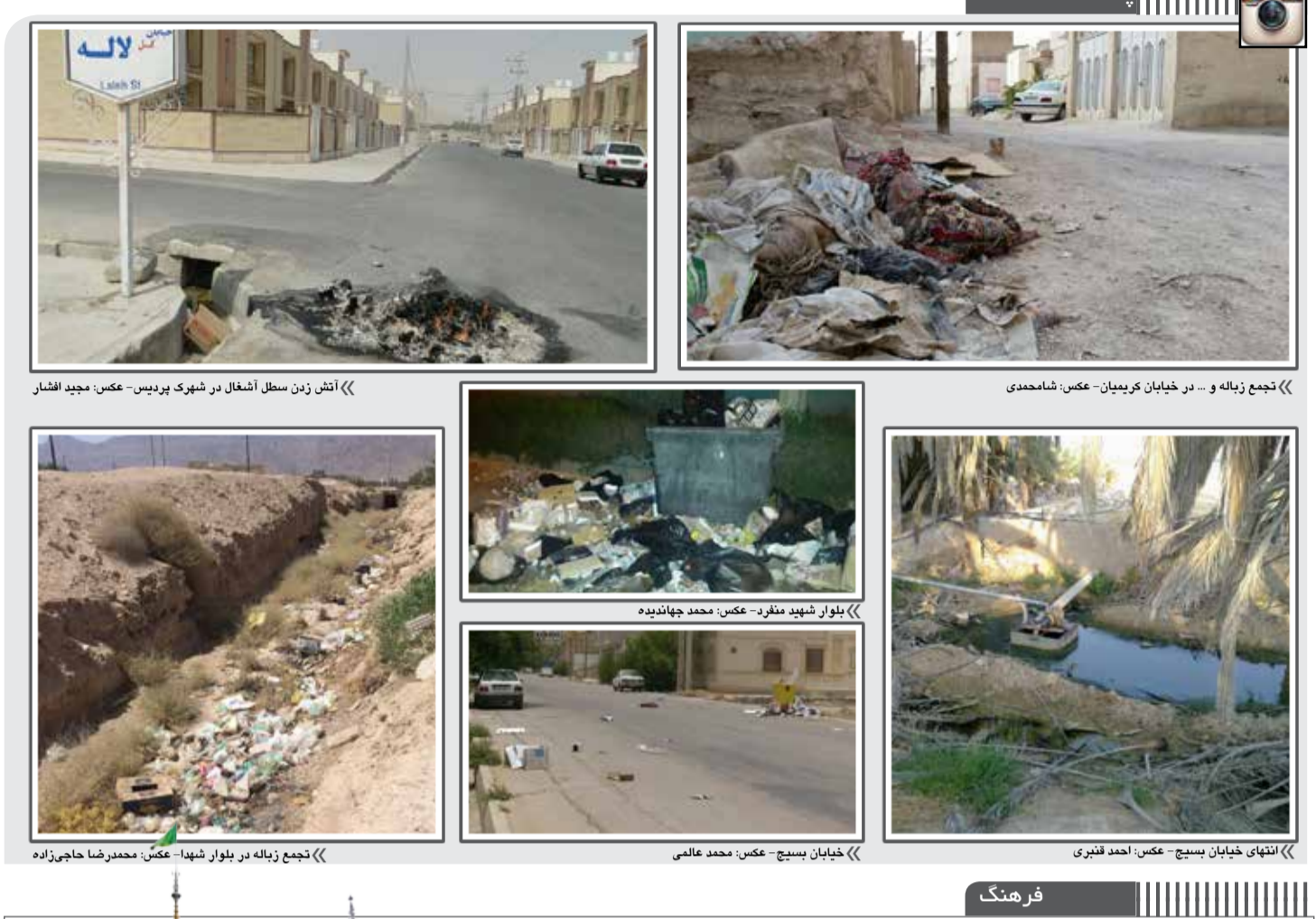
جمع زباله و ... در خیابان کریمیان آنتن زدن سطل آشغال در شهرک پردیس بلوار شهید منقر انتهای خیابان بسیج خیابان بسیج جمع زباله در بلوار شهدا

Some words and Expressions in this news story: Industrial Estate (or Industrial Park): شهرک صنعتی Infrastructure: زیرساخت Investment: سرمایه‌گذاری Scientific management: مدیریت علمی Advantages: مزیت‌ها Exemption: معافیت Tax: مالیات Loan: وام