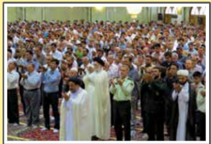
«نماز عید فطر در حسینیه اعظم»