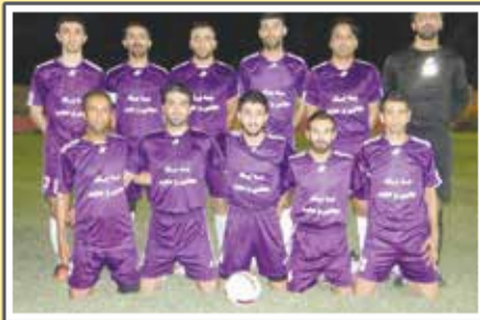
«جوشن صدرنشین فوتبال گراش»