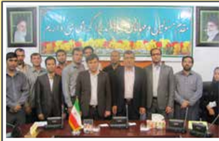
«تجلیل از دهباران گراش»