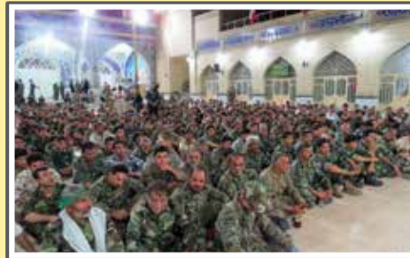
«برگزاری رزمایش مدافعان ولایت»