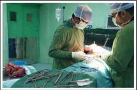
عمل جراحی روده بیمار فلسفی در بیمارستان گراش در شبهای فدر