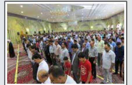
نماز عید فطر در حسینیه اعظم