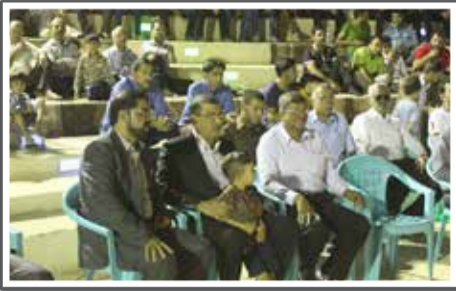
برگزاری جنگ شادی در پارک شهر