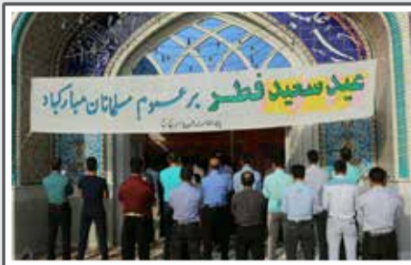
نماز عید فطر در حسینیه چهارده معصوم (ع)