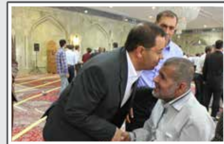
نماز عید فطر در حسینیه اعظم