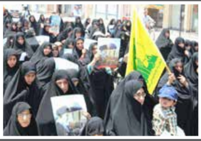
راهپیمایی روز انس در گراش