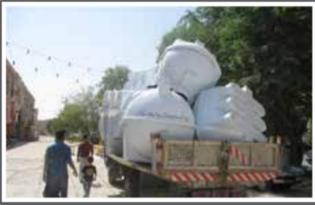
ارسال بسته‌های آب برای نلسین آب سالم مناطق روستایی و عشایری