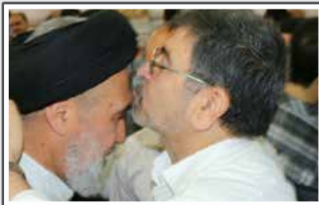
نماز عید فطر در حسینیه چهارده معصوم (ع)